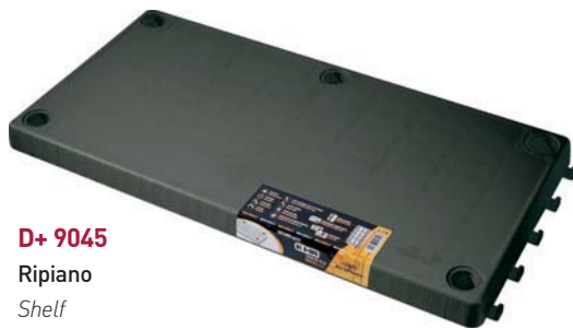
D+ 9045 Ripiano Shelf

Quinta colonna opzionale (pag 65) fifth column optional (page 65)