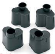
D+2 Piedini Feet