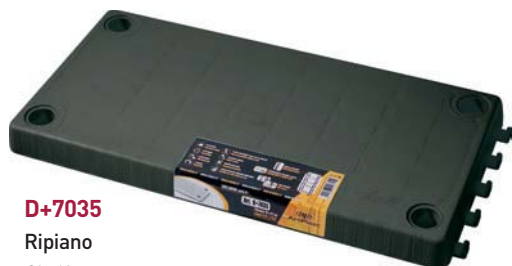
D+7035 Ripiano Shelf