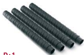
D+1 Colonne Columns