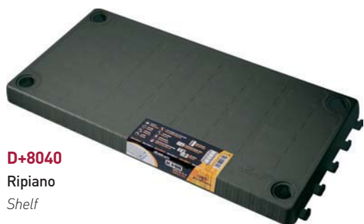
D+8040 Ripiano Shelf