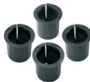
D+3 Ghiere Rings